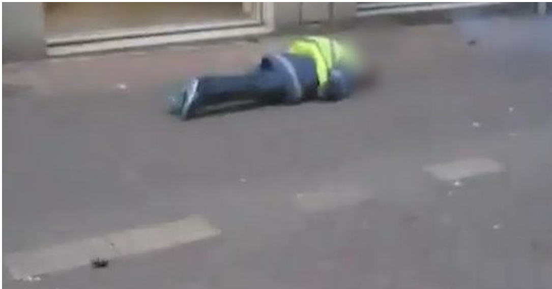
Dit is het eerste dodelijke ONGEWAPENDE slachtoffer. In het achterhoofd geschoten door een politieagent.

stoppen om tomeloos geweld te gebruiken tegen ongewapende burgers. We leven niet in de Zionistische vazalstaat Israël van de Rothschildfamilie waar Palestijnen worden afgeschoten als dolle honden omdat ze met stenen naar een tank gooien. WIJ ZIJN GEEN PALESTIJNEN! Wij betalen het salaris van politiek, politie en leger. Zij MOETEN doen wat de burger wil, niet wat de kontenneukers willen dat ze doen.