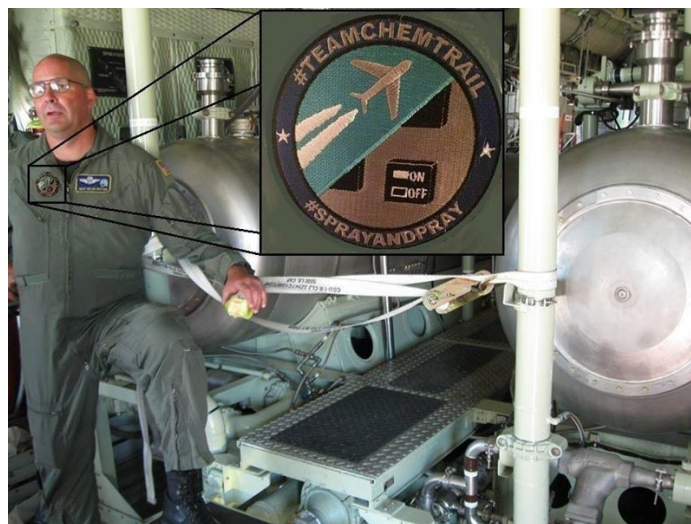
Zo ziet het interieur eruit in een vliegtuig dat het weer kunstmatig kan beïnvloeden

Geloof me. De ‘ spritsers ’ bestaan. Ik heb ze ontmoet. Ik heb met ze gesproken.