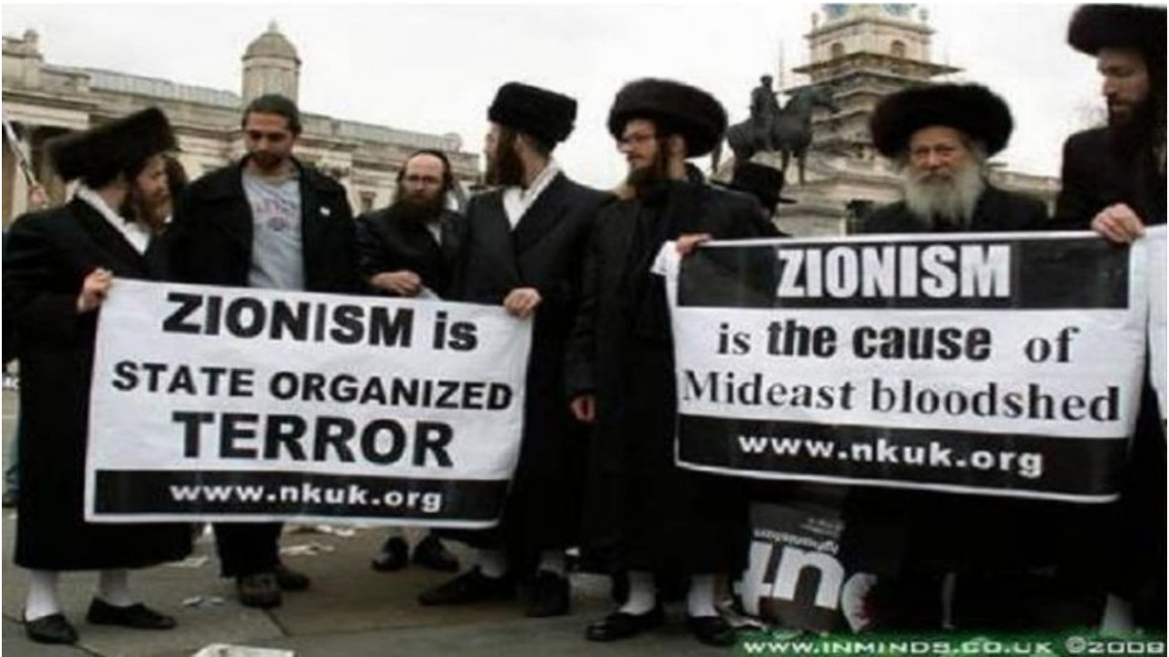
Zionisme is feitelijk Rothschildisme en ook onze politici werken hieraan mee

U denkt dat Zionimse gewoon geen politieke stroming is? Ik zal u een foto laten zien. Joden protes-teren in Engeland TEGEN Zionisme.